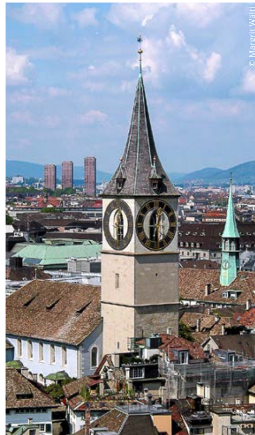
Sakralbauten in Zürich sind teuer

Zu reden gab auch der neuerdings erhobene Eintritt fürs Fraumünster. Dieses informierte, dass dies zur Erreichung von mehr Stille für Betende geschehe und zur Deckung des dadurch entstehenden Mehraufwands fürs Personal. Also keine Idee, um Mehreinnahmen zu generieren. Sollte aber der möglichst uneingeschränkte Zugang für die vielen Touristen nicht höher gewertet werden als die Stille für wenige? Sie könnten auf die Wasser- oder Predigerkirche verwiesen werden.