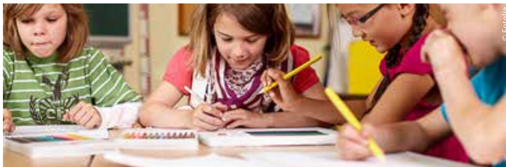
Verschwindet eine der Fremdsprachen aus der Primarschule?