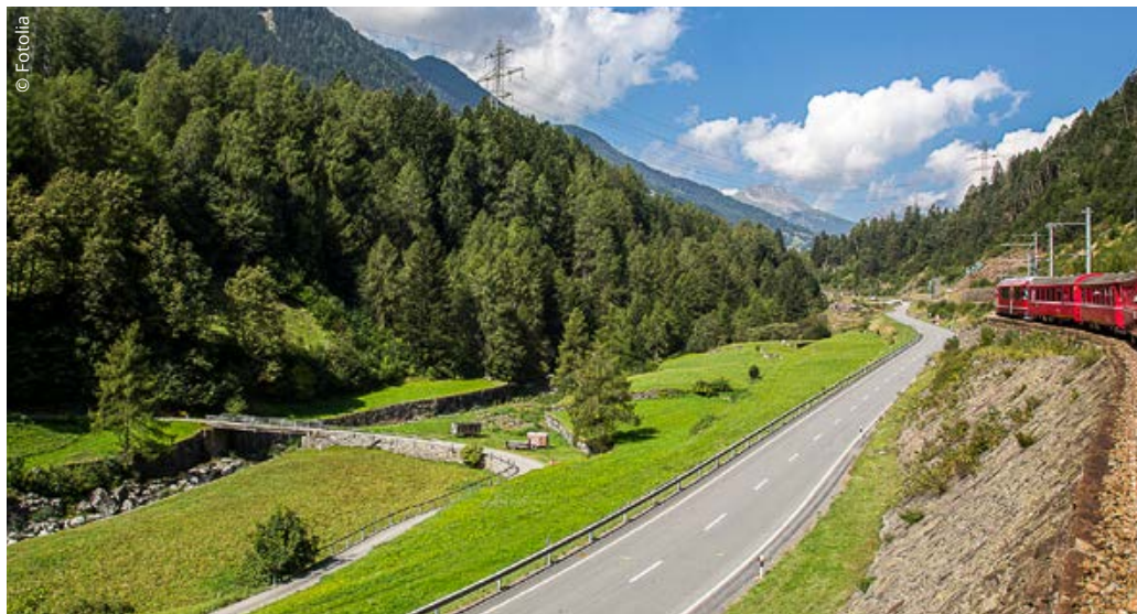
Schiene und Strasse dürfen nicht gegeneinander ausgespielt werden

Kritische Stimmen bemängeln, dass der Strassenverkehr mit dem NAF allzu üppig profitiere, und dies erst noch zulasten des allgemei-