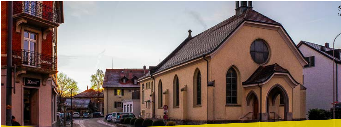
In dieser Kirche in Uster wurde 1917 die EVP gegründet