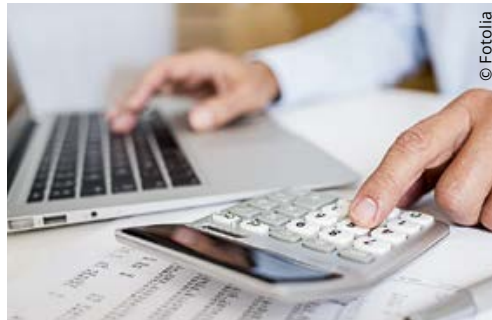
Wie man auch rechnet, das USR III geht für Kantone und Gemeinden nicht auf

Werden die Privilegien ohne flankierende Massnahmen aufgehoben, wird jedoch befürchtet, dass die meisten Statusgesellschaften die Schweiz verlassen. Die Gleichbehandlung mit den übrigen Unternehmen ist ihnen zu teuer. Was tun, um sie hier zu behalten? Über die Ausgestaltung der neuen Regeln und die damit verbundenen Steuerausfälle wird heftig gestritten. Die Ausgestaltung obliegt den Kantonen in dem vom Bund vorgegebenen Rahmen. Auf Details können wir an dieser Stelle nicht eingehen. Die EVP betrachtet die zu gewärtigenden Steuerausfälle von 2,7 Mrd. Franken indessen als viel zu hoch, zumal sie auch Städte und Gemeinden stark treffen. Sie verlangt eine steuerneutrale Lösung. Dafür genügt es, die vorgesehenen massiven Abzugsmöglichkeiten auf ein vernünftiges Mass zu reduzieren. Ein NEIN am 12. Februar macht den Weg dazu frei. An der Delegiertenversammlung entfielen auf diese Parole 72:4 Stimmen.