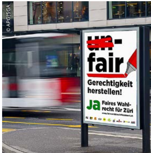
Das Plakat bringt das Anliegen auf den Punkt

Die 5%-Hürde hat aber genau diese Wirkung. Sie besagt, dass eine Partei nur dann in den Gemeinderat kommt, wenn sie in mindestens einem Wahlkreis mindestens 5% der Stimmen macht. 2014 mussten deshalb die Wahlzettel von 5200 EVP- und andern Wählerinnen und