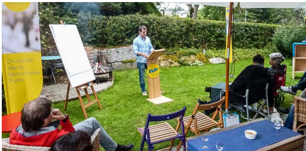
Referent am Anlass «Politik mit Feuer» der EVP Affoltern am Albis, Sommer 2016

Mit »Politik mit Feuer« (Politdiskussion mit Grillparty), Jakobsweg-Wanderung und der Präsenz am Chlaus-Märt haben wir Gefässe geschaffen, die mittlerweile einen hohen Bekanntheitsgrad aufweisen und uns als EVP im Dorfleben wahrnehmbar machen. Zu all unseren Aktivitäten gehört die Medienarbeit. Vor dem Anlass wird mit Inserat und redaktionellem Text in der Regionalzeitung geworben und eingeladen. Nochmals ein Bericht mit Bild erscheint dann nach dem Event. Neu ist geplant, dass wir an den Events mit gezielten Werbe-Sets auf unsere Partei aufmerksam machen. Sie bestehen aus Portrait-