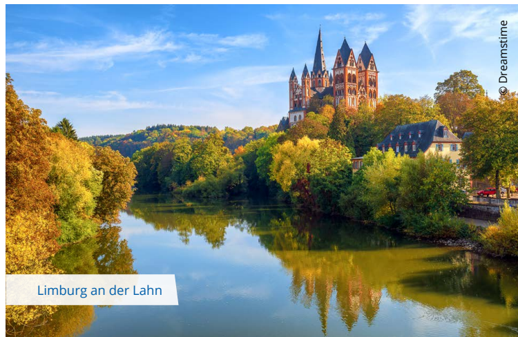
Limburg an der Lahn

Keine Erlasse des Bundes zur Abstimmung und Verzicht auf die Anordnung einer kantonalen Volksabstimmung