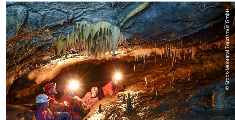
Das Hölloch zählt zu den grössten Höhlensystemen der Welt.

Thema: Summer-Event *jevp Ort: Basel Zeit: 14 bis 17 Uhr Organisation: *jevp Schweiz